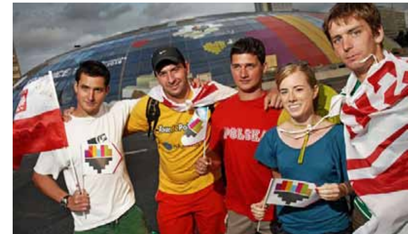
Kibice podczas Tour De Pologne w Katowicach. Sierpień 2010 r.