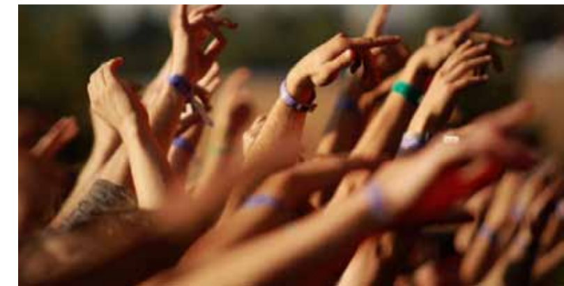
Publicność podczas Off Festivalu w Katowicach na Muchowcu.

– Jesteśmy pierwsi, najbardziej zaangażowani, stanowimy wzorzec dla kolejnych miast. Pojawia się już kon-