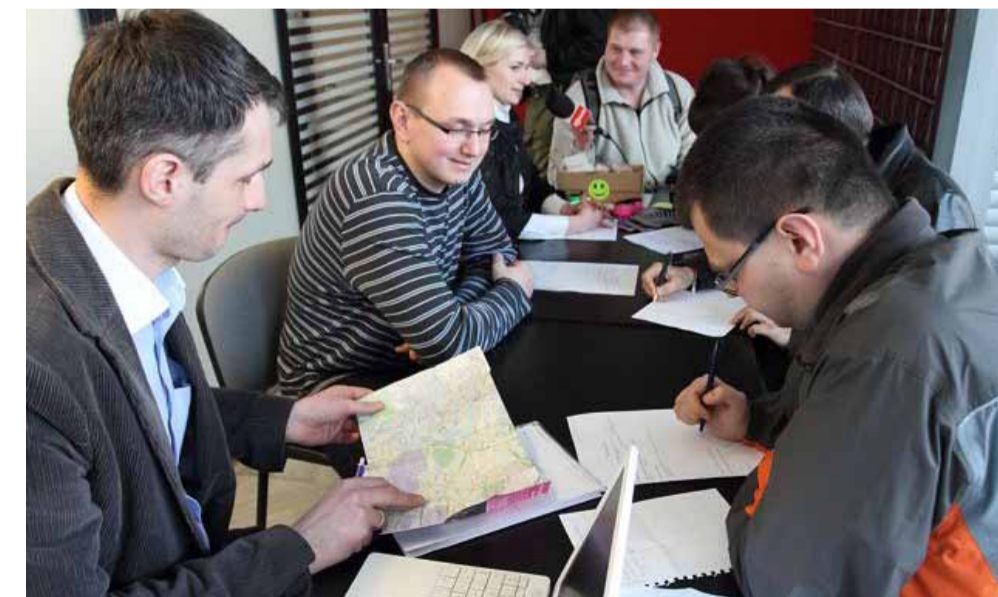
Przyjmowanie petentów na dworcowym holu.

W Radzie Miasta zasiada 25 radnych, wybranych w wyborach powszechnych na 4-letnią kadencję.