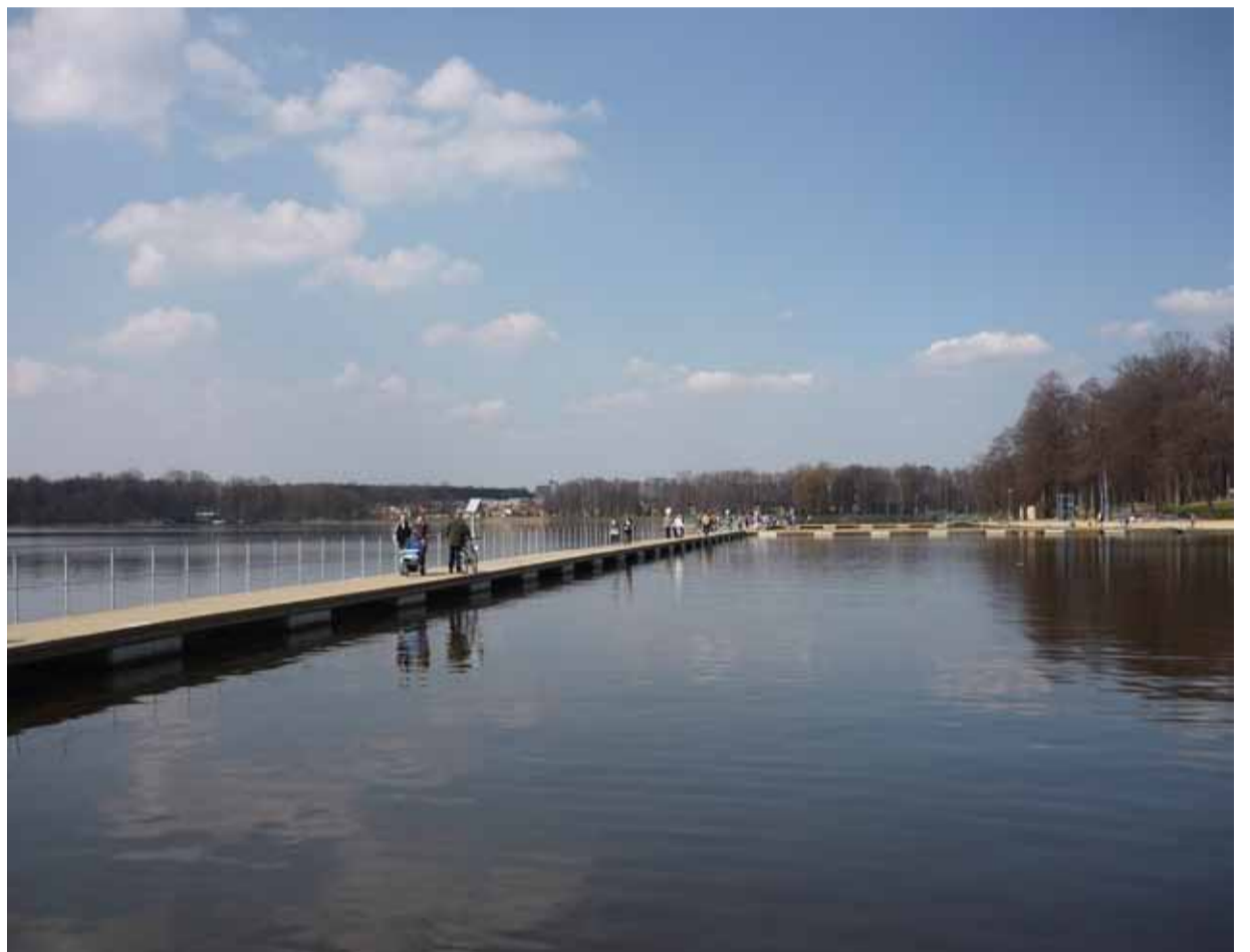
Każdy z nas może mieć wpływ na wygląd naszego miasta.