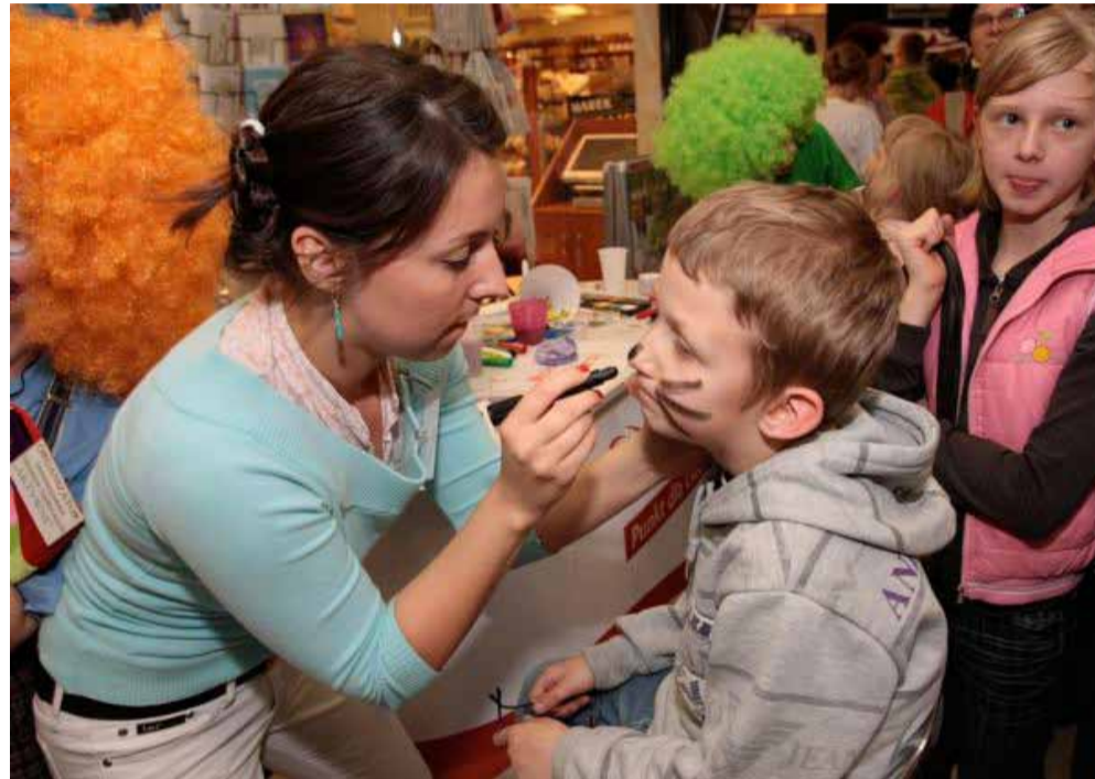
Dzień Dziecka w Centrum handlowo-rozrywkowym City Point, połączony ze zbiórką pieniędzy na budowę Hospicjum św. Kaliksta I w Tychach

Będę kontynuowała dotychczasowe działania. Na pewno będę starać się o wspomnianą już sygnalizację, bo uważam, że jest ona bardzo potrzebna – z przejścia przy skrzyżowaniu ulic Sikorskiego i Żółkiewskiego korzystają nie tylko mieszkańcy osiedla Z-1, ale też mieszkańcy, którzy idą lub wracają z kościoła p.w. św. Maksymiliana Kolbe. Zależy mi również na utworzeniu boiska na naszym osiedlu – ma powstać tuż pod lasem.