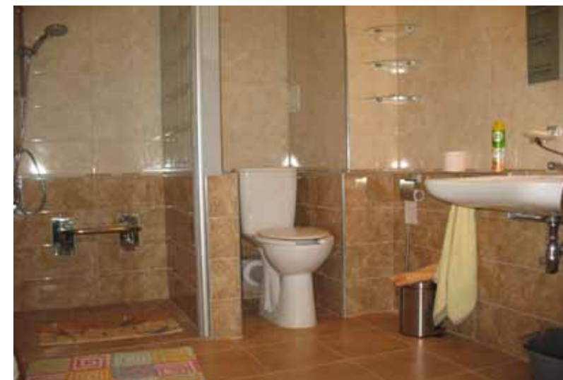
Łazienka w mieszkaniu dla niepełnosprawnych.

W tygodniu nie musi gotować, bo obiady są tutaj przywożone. Podobnie problem obiadów rozwiązano w mieszkaniu dla osób niepeł-