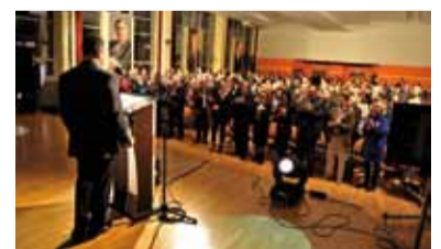
Konwencja odbyła się w auli tyskiej szkoły muzycznej.

Bo Ty jesteś gwarantem zmian – na lepsze. Wygraj te wybory!