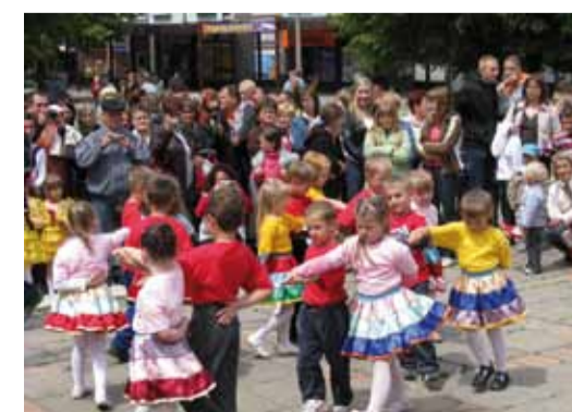
Zdjęcia z festynów organizowanych na osiedlu K.

Krzysztof Woźniak Okręg nr 4 MIEJSCE NR 4 KOMITET WYBORCZY WYBORCÓW PREZYDENTA ANDRZEJA DZIUBY.