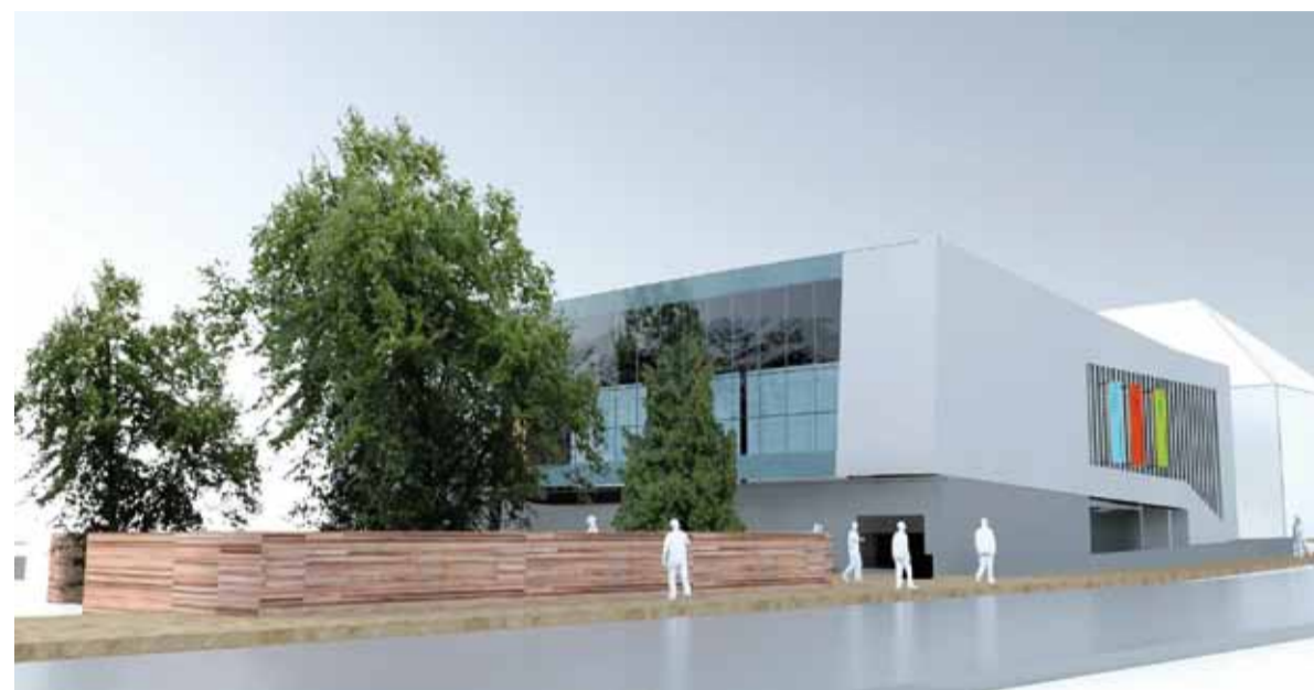
Pasaż Kultury Andromeda.

Życie kulturalne miasta jest jednym z ważnych czynników wpływających na jego rozwój, integrację mieszkańców i wzrost poczucia przynależności do danej społeczności.