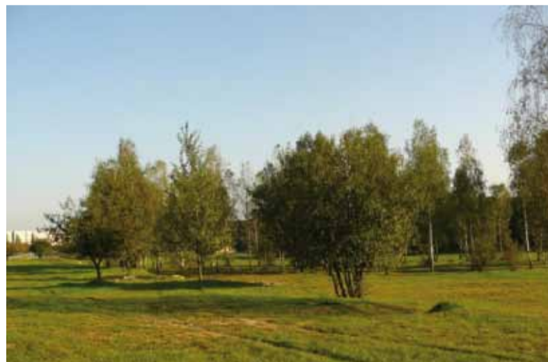
Teren przy ul. Sikorskiego przewidziany pod inwestycję.

Autorzy studium zaproponowali, by projektowany kompleks wodny nosił nazwę „Termy Paprocańskie”. Jednak nie wiadomo czy tyszanom przypadnie do gustu ta propozycja. Z całą pewnością lepszym pomysłem będzie ogłoszenie konkursu na nazwę tego obiektu. Mamy nadzieję, że inwestor – Regionalne Centrum Gospodarki Wodno-Ściekowej SA – przychyli się do tego pomysłu i zorganizuje taki właśnie konkurs!