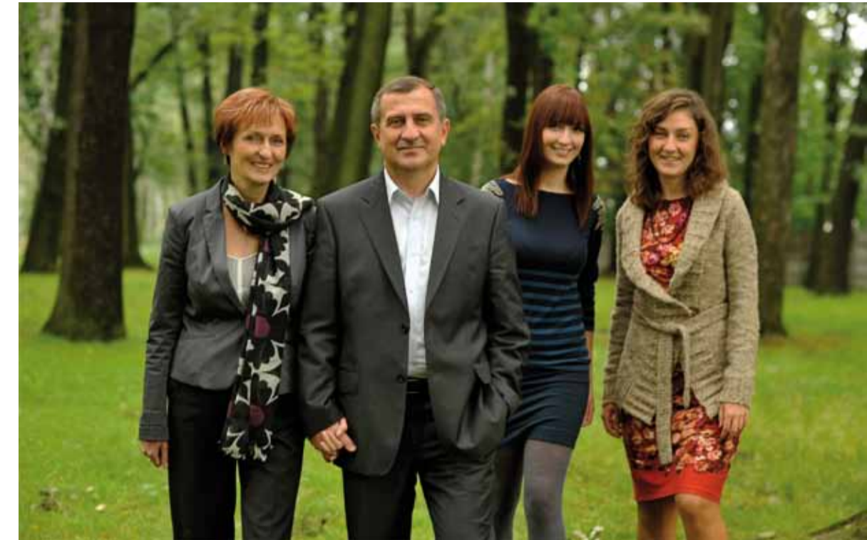
Prezydent Andrzej Dziuba z żoną Ewą i córkami Martą i Olą.

województwa śląskiego. Czy takie inwestycje są miastu potrzebne?